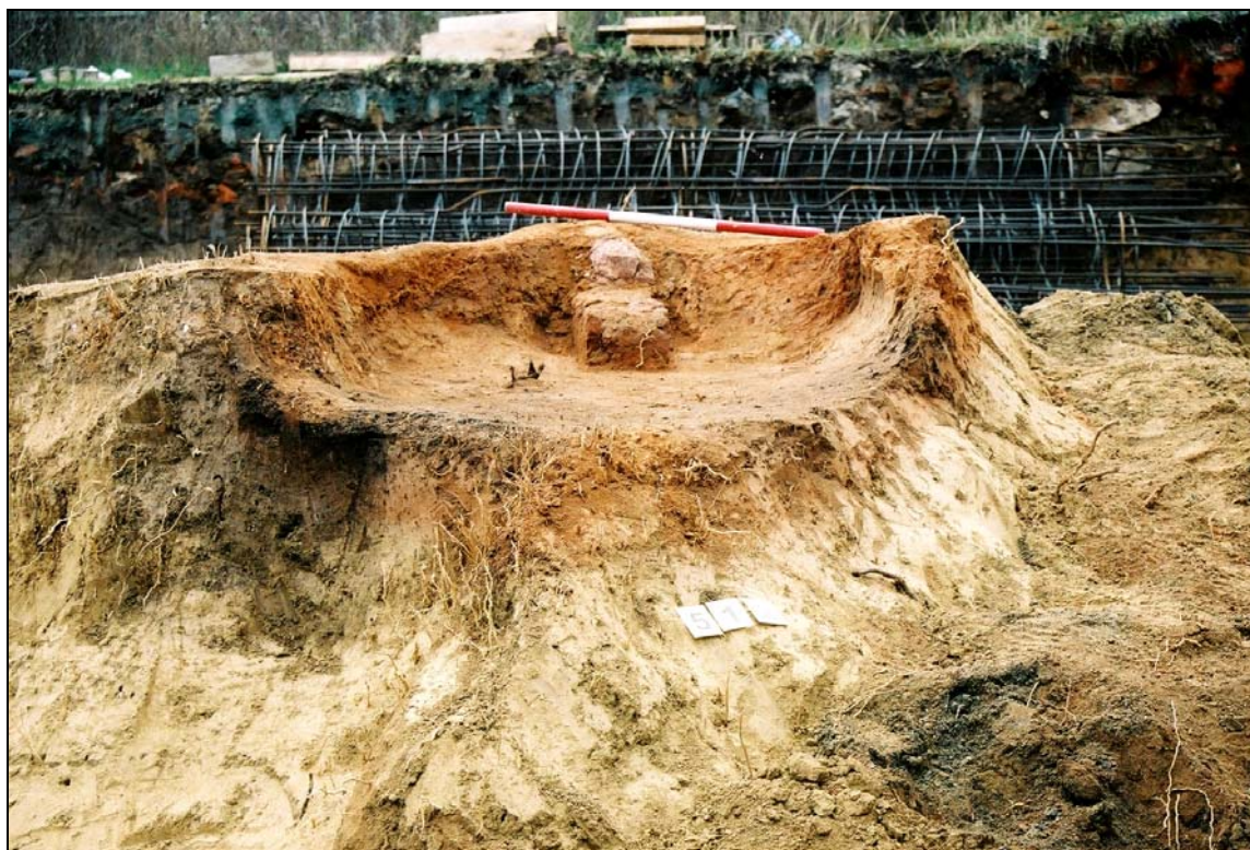
Obr. 2 Pohled do pece od severu