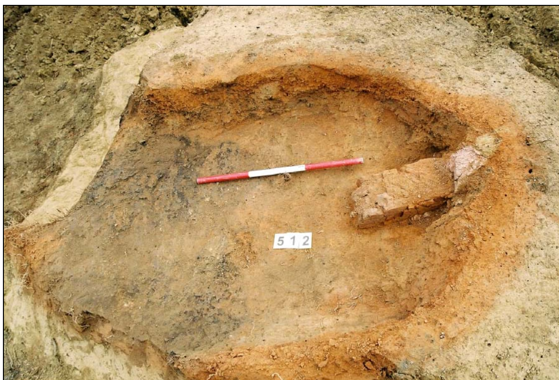
Obr. 3 Pohled na pec od západu