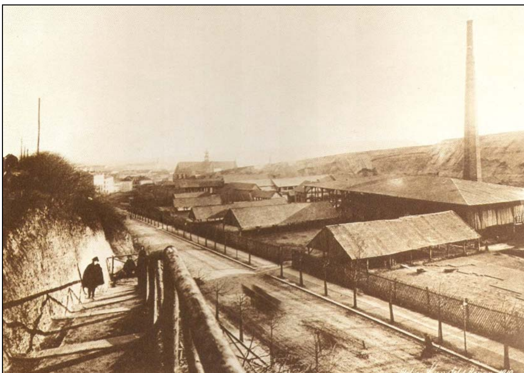
Obr. 1 Cihelna na Úvoze r. 1910 (převzato ze Samek–Hrubý 1982, obr. 147)