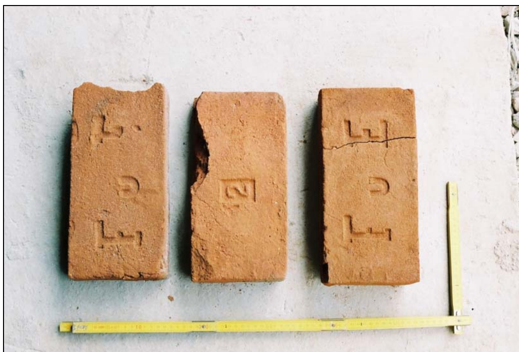
Obr. 6 Cihly z konstrukce pece