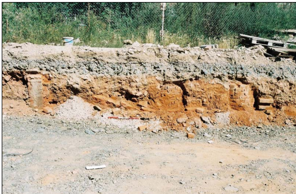
Obr. 5 Řez P5 se zachycenou stěnou komory pece a odtahovým kanálem