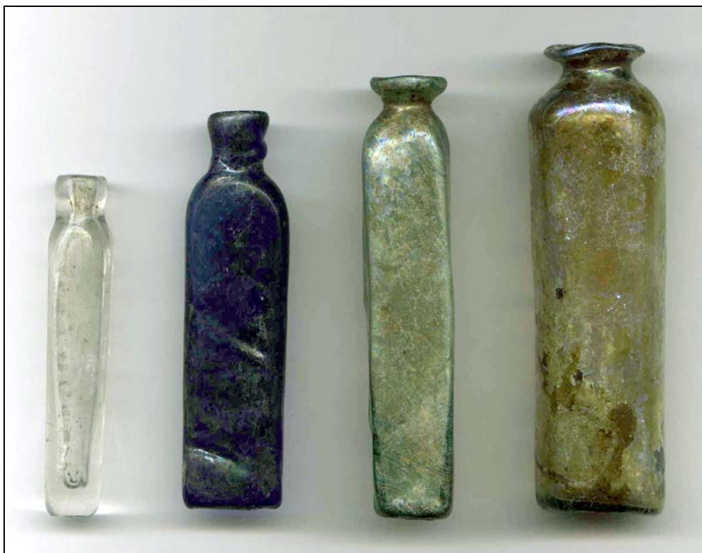
Obr. 5 Ukázky produkce sklárny – mastičkářské a voňavkářské flakónky