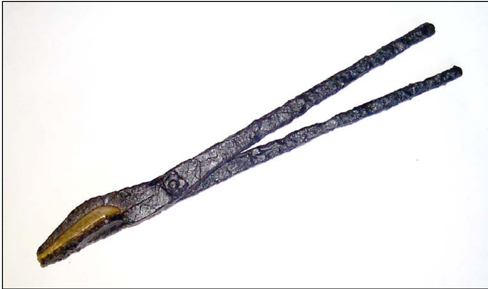
Obr. 7 Železné kleště s patrně mosaznou formou na tvarování lustrových ověšků