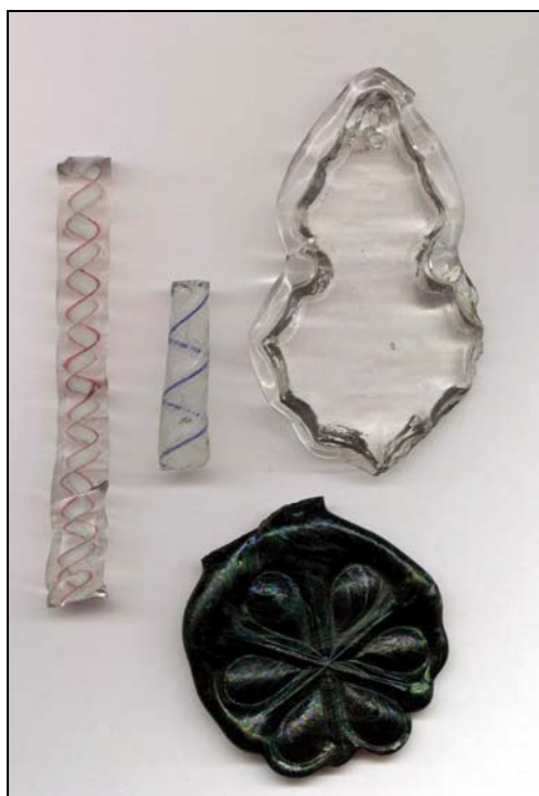
Obr. 6 Ukázky produkce sklárny – lustrové ověšky a fragmenty armatur