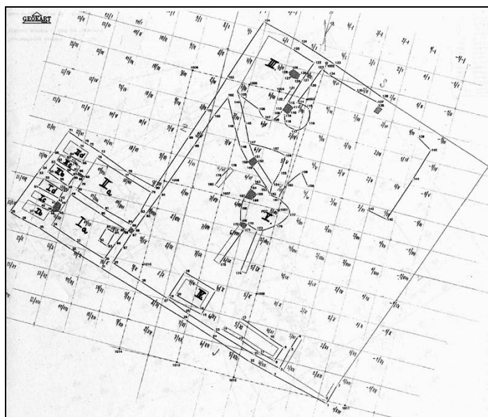
Obr. 2 Sklárna Bedřichov – plánek se čtvercovou sítí