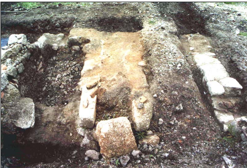
Obr. 4 Částečně odkrytá pec (obj. Ilc ) od východu