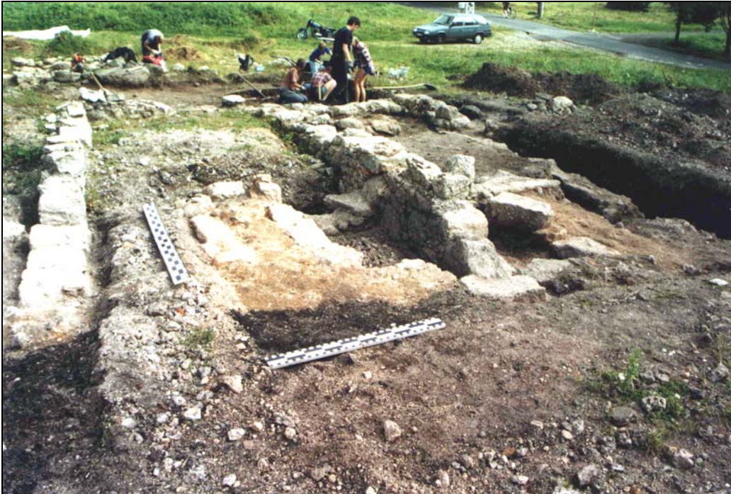
Obr. 3 Pece (obj. Ic a Ilc ) sloužící nejspíše v procesu zušlechťování výrobků