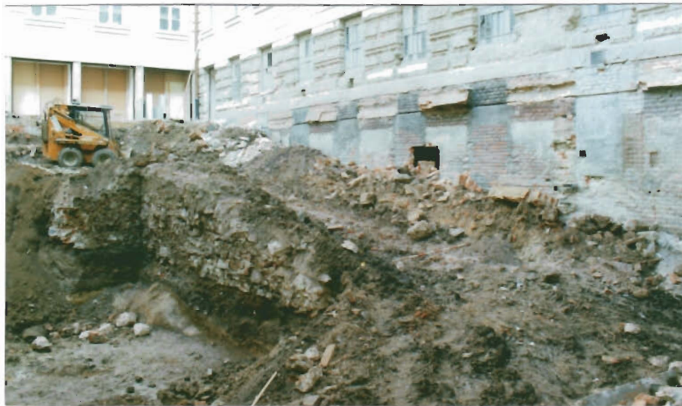
Obr. 2 Stavební rampa z původního podloží a výplně dvora. Vlevo při severní stěně budovy se v tělese rampy skrývala pec č. 2