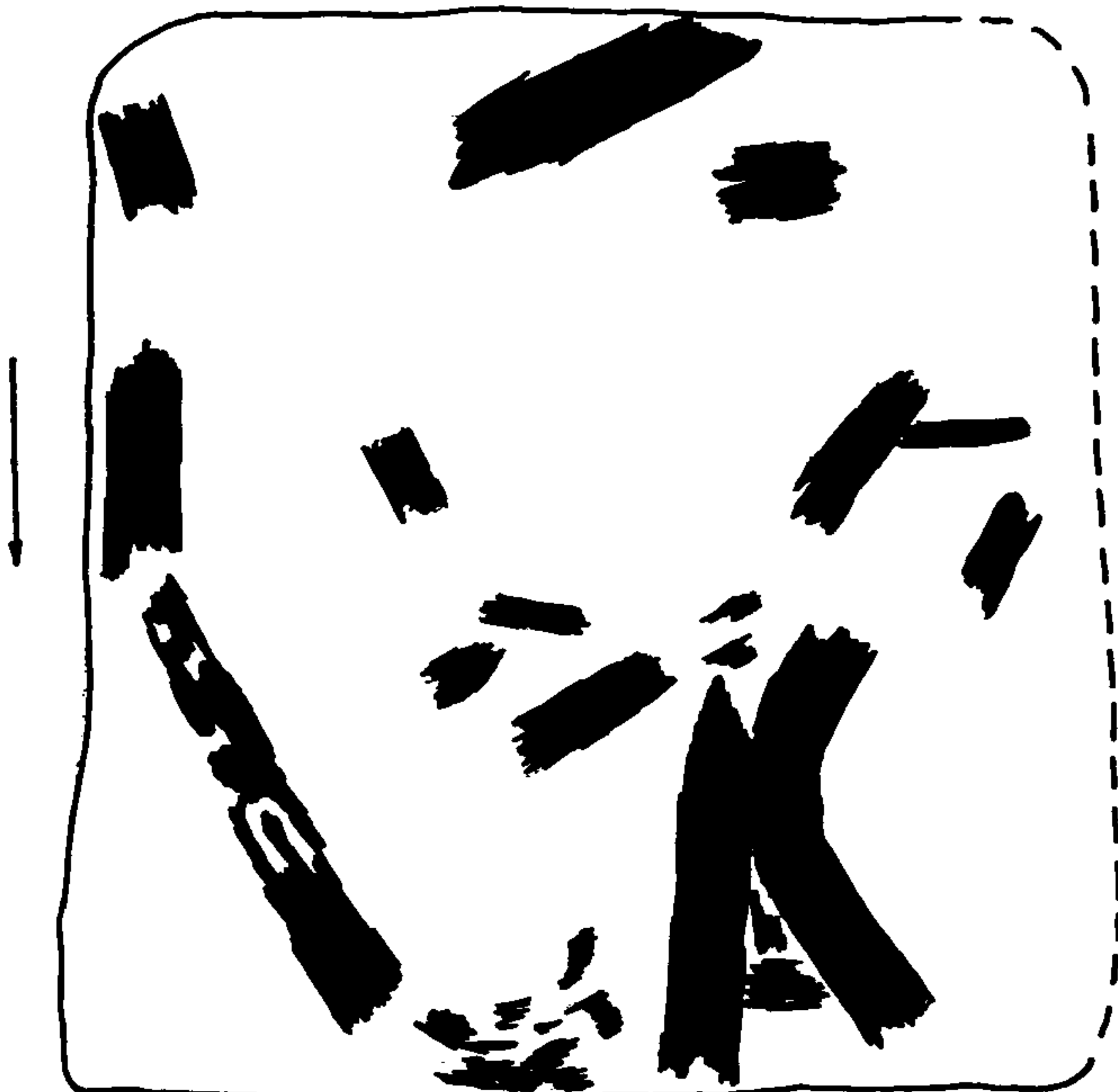
Obr. 3 Podorys objektu č.5/84 po odstránení hornej časti výplne objektu - ílovitej hlíny