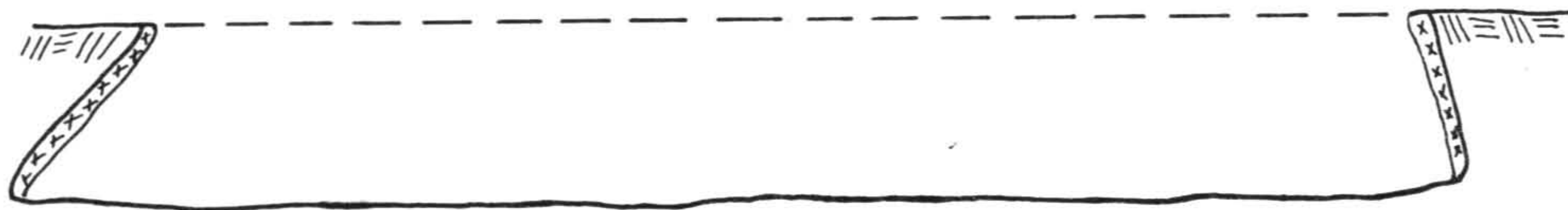
Obr. 2 Profil objektu č. 11/84 po vybratí